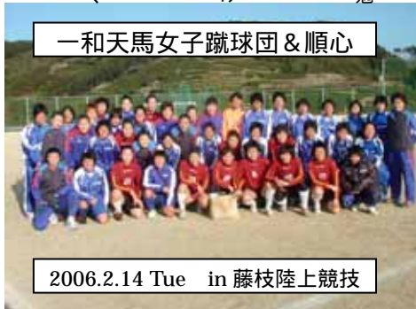
一和天馬女子蹴球団&顺心

韓国女子リーグに参加する一和(イルワ)が、十日から藤枝で最終調整の為に合宿を行っています。その初戦の相手として十四日、顺心高校サッカー部が試合を行いました。韓国の選手達は身長がとても高く、パスを多用してくるサッカーで、勉強になりました。韓国代表選手も三名在籍しており、〇対二で負けたものの異国のチームと対戦出来る貴重な機会に選手達は、多くの事を学び交流を楽しんだようです。